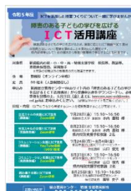
講座案内ポスター